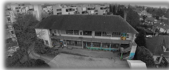
Centre socio culturel Léo Lagrange Musculaton