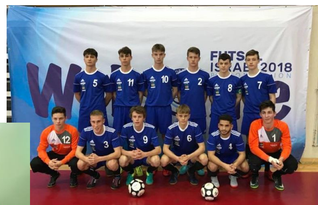
Championnat du monde ISF Futsal- Israël 2018

Des compétitions scolaires pour évaluer la progression