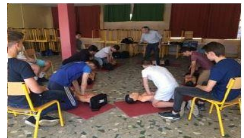
Formation aux gestes qui sauvent

Des formations qualifiantes à destination des joueurs