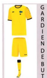
KIT inclus dans la cotisation Y compris marquage Logo du club + Initiales Tailles 6 ans à 2XL