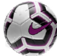
10 BALLONS NIKE TAILLE 5