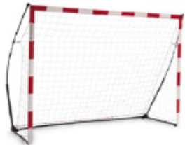
1 PAIRE DE BUTS 3X2