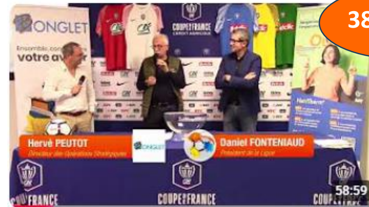
Tirage de Coupes - mardi 30 septembre 2025