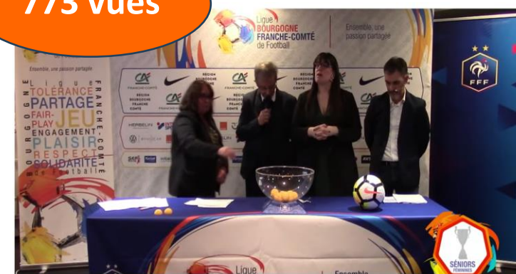
Tirages de Coupes – mardi 11 mars 2025