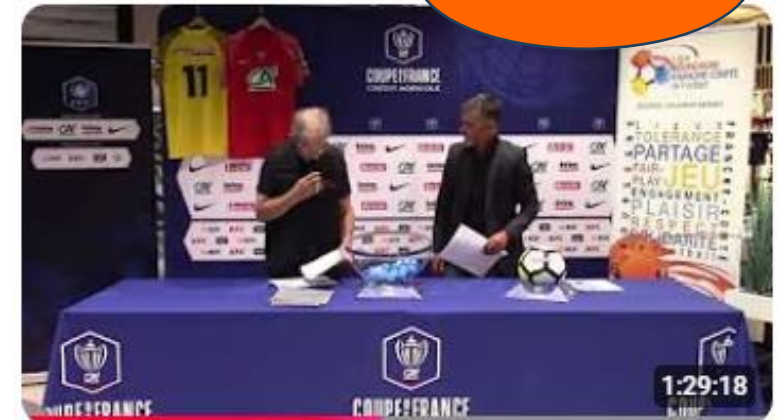
Tirage de Coupes - mardi 16 septembre 2025