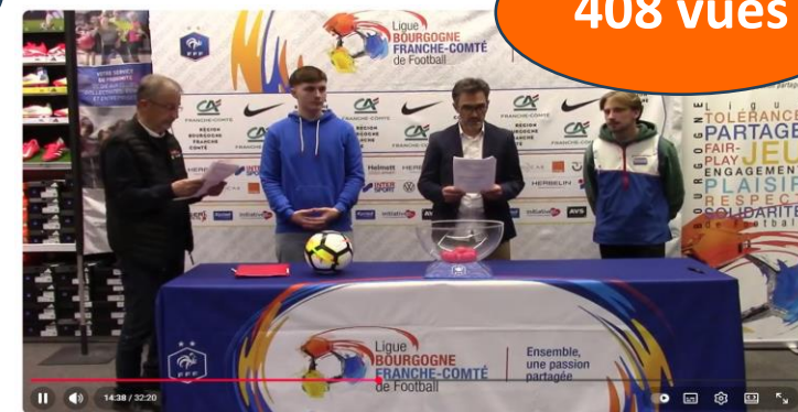
Tirages de Coupes - jeudi 24 avril 2025