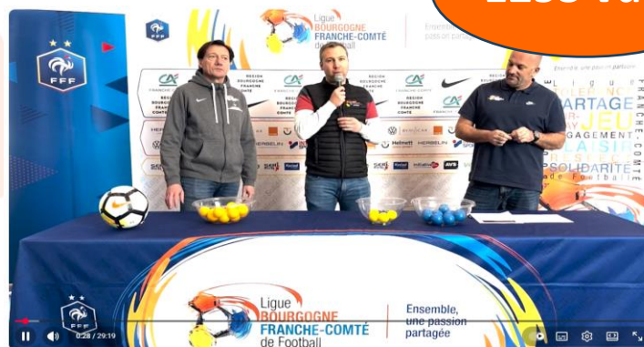
Tirage au sort Festival U13 Pitch 2025 – vendredi 11 avril 2025