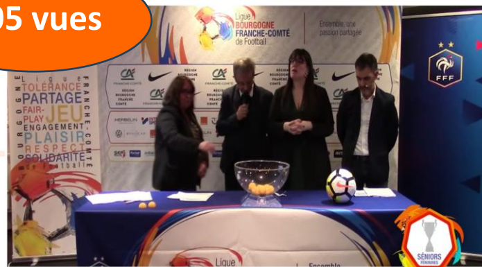
Tirage de Coupes – mardi 11 février 2025