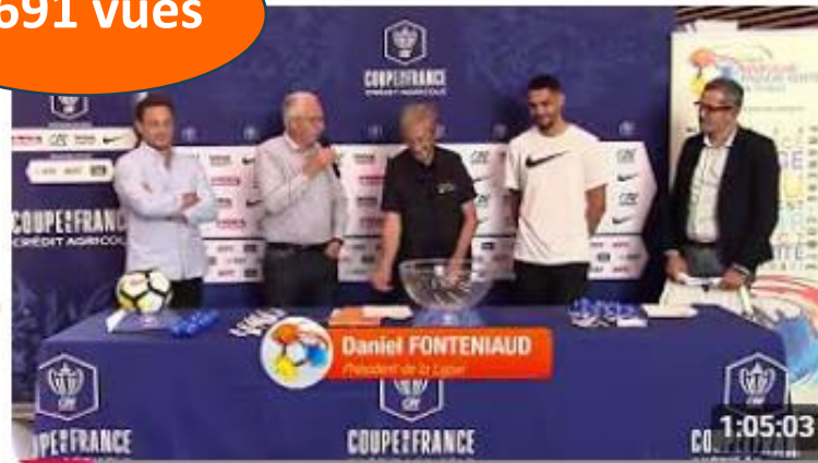
Tirage de Coupes - mardi 2 septembre 2025