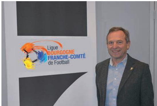
Le Président de la Commission Jacques QUANTIN

Cette saison s'est caractérisée par la poursuite de la structuration de l'organisation de l'IR2f. Le regroupement de toutes les formations (éducateurs, dirigeants, arbitres) au sein de cet organisme a été achevé à l'été 2019 et deviendra opérationnel dès la rentrée 2019.