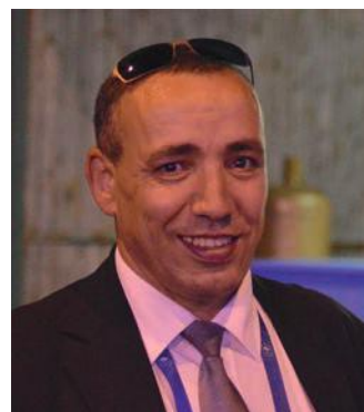
Le Vice-Président Mohammed KERZAZI

A l'aube de la nouvelle saison qui se profile, nous attendons confirmation des dates pour les nouveaux promus, qu'ils soient félicités, pour une nouvelle formation en compagnie de tous les clubs de N3 et R1 qui étaient déjà là la saison passée.